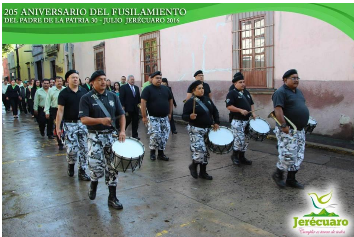
TRASLADO DEL CONTINGENTE DE PALACIO MUNICIPAL HACIA PLAZA PRINCIPAL