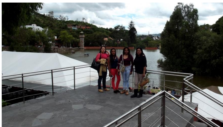
ARRIBO A LA PRESA DE LA OLLA