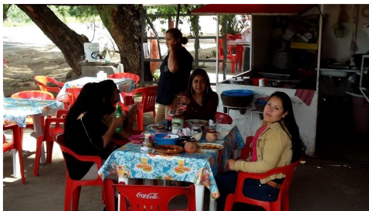
EL EQUIPO DE TRABAJO CONSUMIENDO EL DESAYUNO CERCA DE LA CIUDAD DE GUANAJUATO.

EL SÁBADO 23 DE JULIO SE ARRIBÓ A LA CIUDAD DE GUANAJUATO PARA ASISTIR A LA CELEBRACIÓN EN COMENTO.