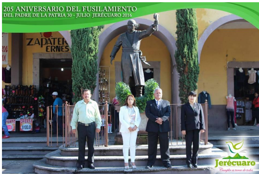
INTEGRANTES DEL H. AYUNTAMIENTO MONTANDO GUARDIA DE HONOR