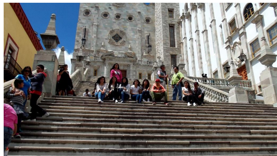
FOTOS PARA RECORDAR ESCALINATA DEL AULA MATER UNIVERSIDAD DE GUANAJUATO