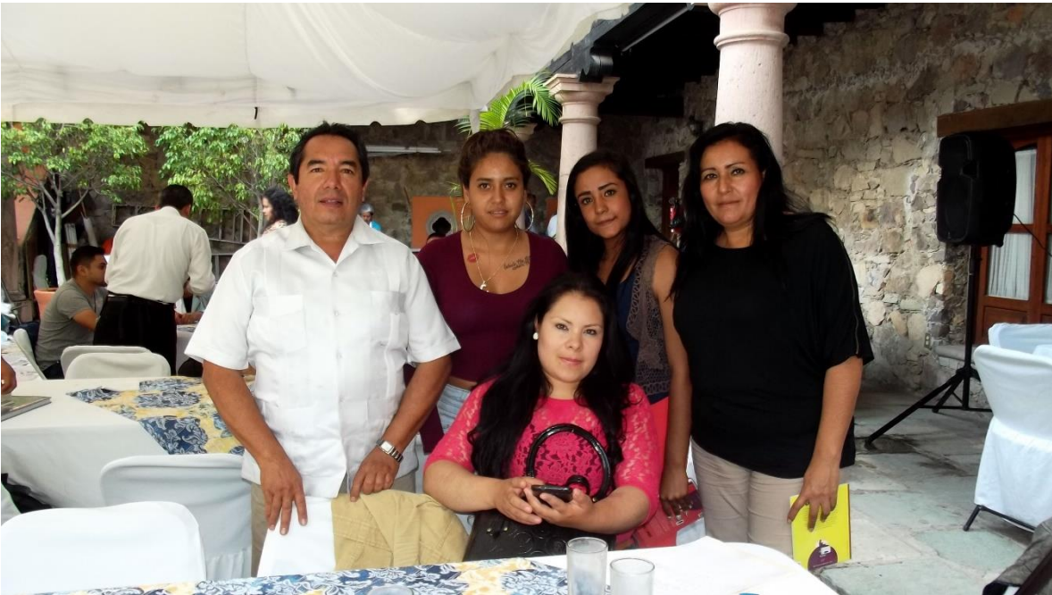
PARTICIPANDO EN EL INSTITUTO ESTATAL DE LA CULTURA