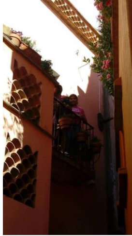
ALUMNA VISITANTE EN EL BALCÓN DEL LEGENDARIO CALLEJÓN DEL BESO