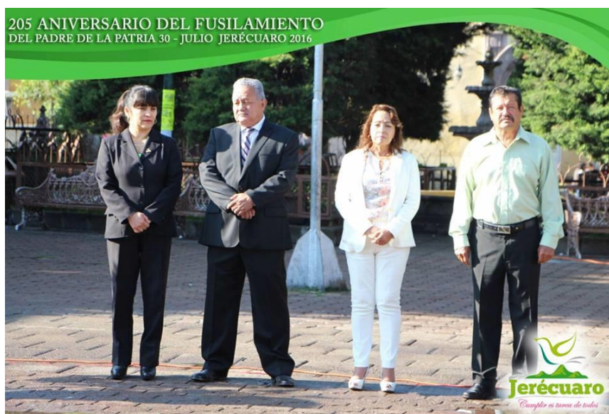
REALIZACIÓN DEL HOMENAJE EN LA PLAZA PRINCIPAL