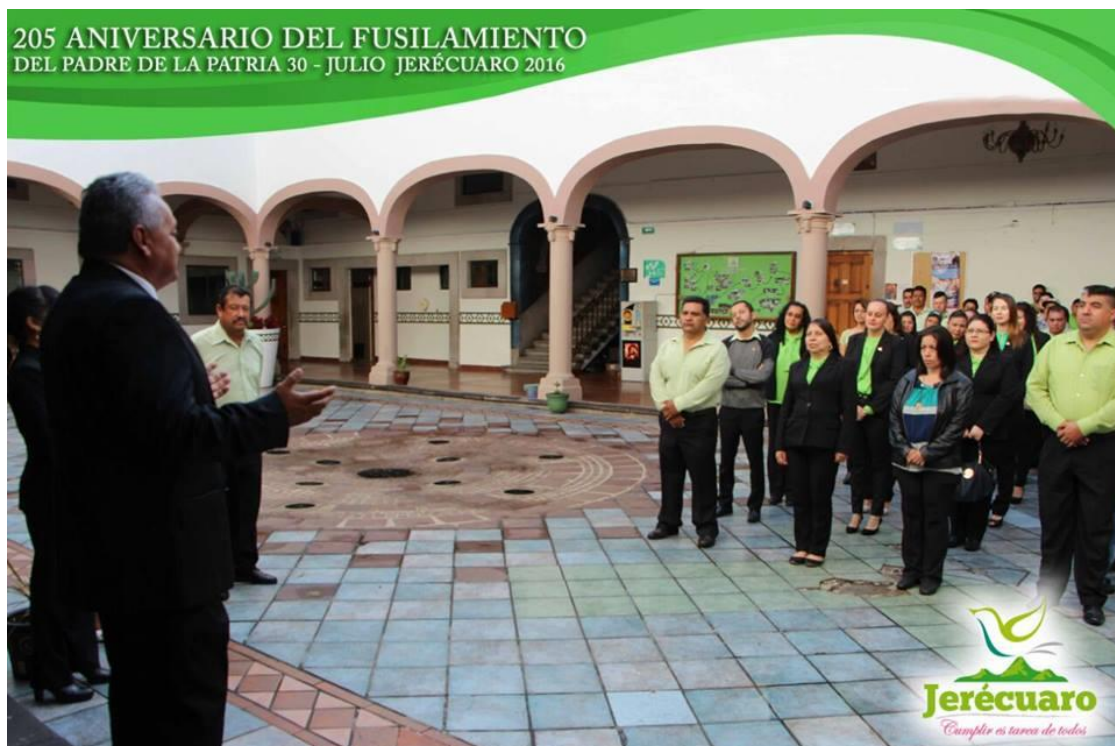
MENSAJE DEL ALCALDE AL PERSONAL ASISTENTE