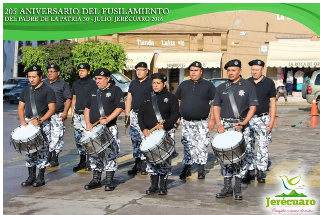
BANDA DE GUERRA MUNICIPAL