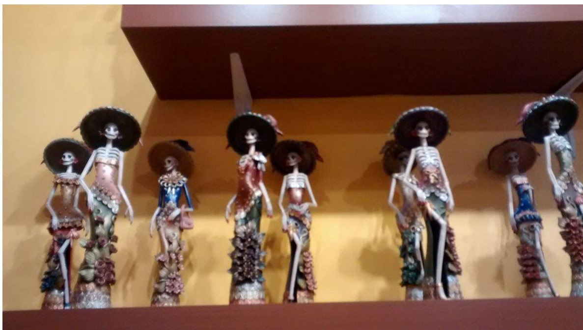
VISITANDO DULCERÍA LA CATRINA