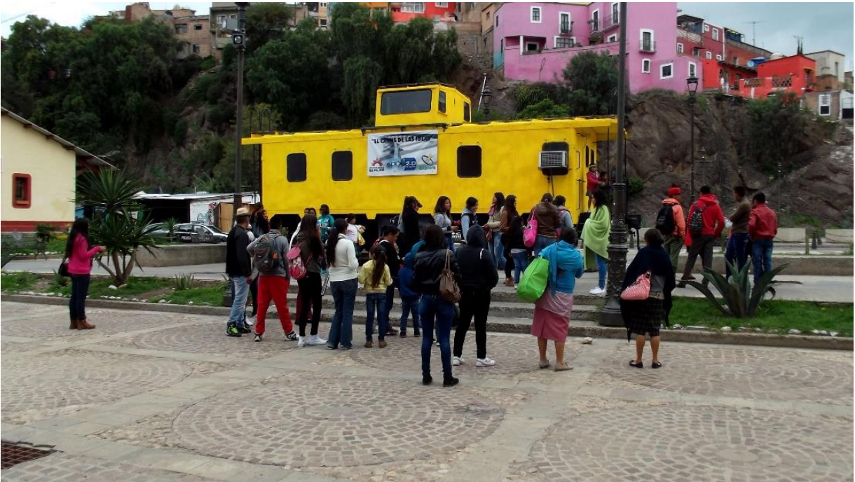
ANTIGUA ESTACIÓN DEL FERROCARRIL