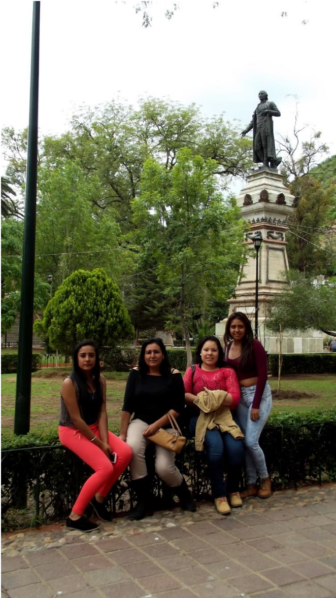
ENTORNO DE LA CASA DE GOBIERNO