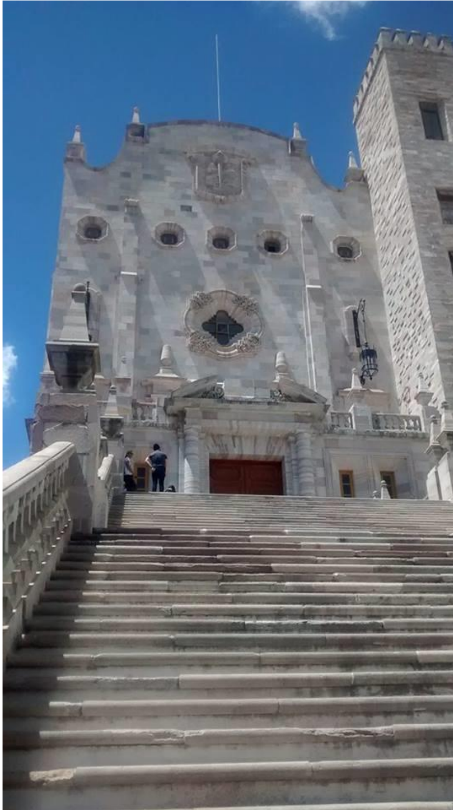
VISTA DE LA ESCALINATA AULA MAGNA DE LA UNIVERSIDAD DE GUANAJUATO