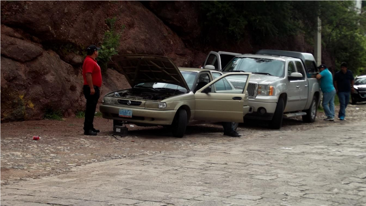
REPARACIÓN DEL VEHÍCULO POR PERSONAL DE PRESIDENCIA MUNICIPAL, CON APOYO DE PROTECCIÓN CIVIL.